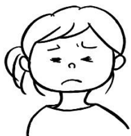
しょぼしょぼする