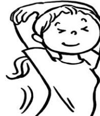
ストレッチをする