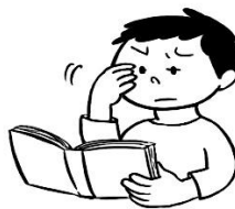
字がかすんで見える